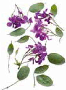
Silberling, Mondviole, Silberblatt