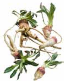
Zweijährige Nacht- kerze, Schinkenwurz, Gelbe Rapunzel, Nachtschönheit