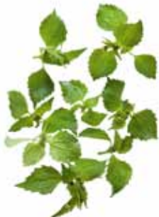
Bewimpertes Knopfkraut, Franzosenkraut