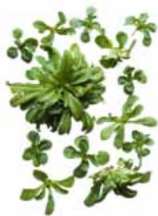
Feldsalat, echter Ackersalat, Rapunzel, Nüsslisalat

Text: Simon Bühler