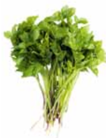
Giersch, Baumtropf, Geissfuss