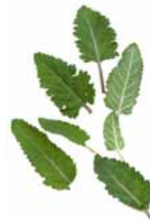
Sauge des prés