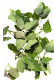
Arroche des jardins, chénopode blanc