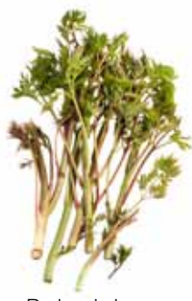
Barbe de bouc