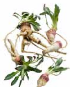
Onagre bisannuelle, jambon du jardinier, herbe aux ânes