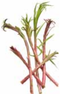
Epilobe à feuilles étroites ou épilobe en épi