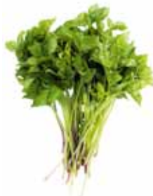
Herbe aux goutteux, égopode podagraire